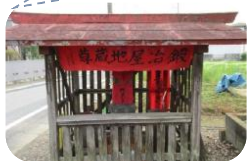
鍛冶屋地蔵（萱方） ・坂戸方面から森戸橋を渡ったら右に入る。

鍛冶屋という土地の名前にちなんだ、大変古い地蔵で、昔は縁日には露店も並びとても賑わったそうである。