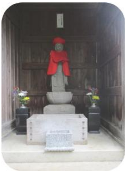
地蔵尊（竹之内） ・薬局のそば

全国をお経を唱えて回っていたお坊さんがここで倒れ、村人の手厚い看病にも関わらず亡くなってしまった。 お坊さんの言い残したとおり、村人は地蔵を建てた。