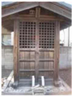
正達地蔵尊（泉町） ・大型衣料品店近く

中耳炎を患った人が、先に掛かっている竹ずっぱのお酒をいただいて来て、耳につけると良く治るといわれる。 無事に治った時は、お酒を入れた竹ずっぱを一本にしてお返しした。