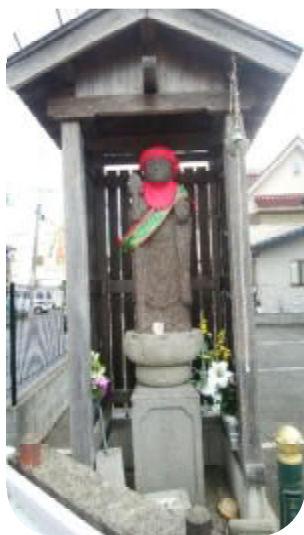
延命地蔵（日の出町） ・日の出町交差点

古い石造地蔵で、子育て地蔵、いぼ地蔵と言われている。いぼで苦しむときには泥ダングを供え、いぼが治ったら、お札に団子を供える。