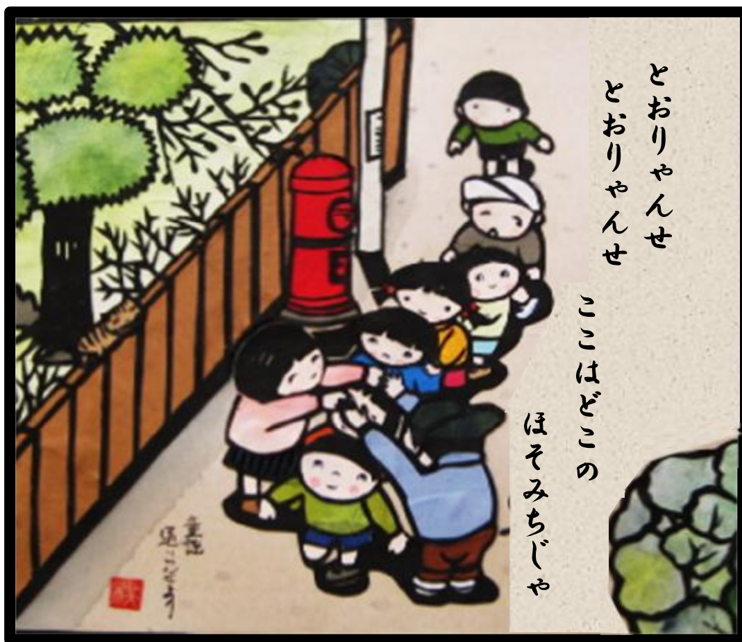
童謡 とうりゃんせより 切り絵