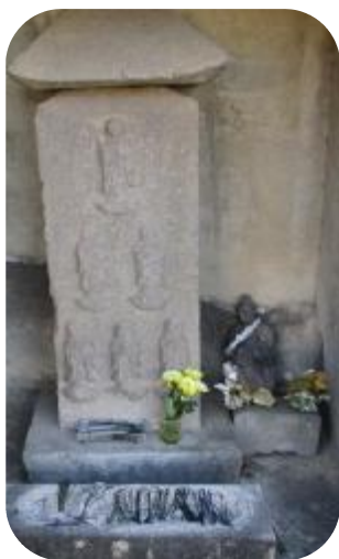
六地蔵（紺屋） ・紺屋集会所東側

市内の辻や街角などに立ち、人々に親しまれているお地蔵さま。その役割も子育て地蔵、いぼ地蔵、由来も様々で、通りすがりに小さな手を合わせる子どもたちの姿など、ほほえましいものです。