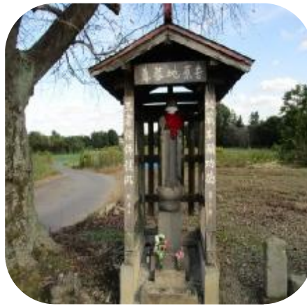
吉原地蔵・森戸橋の近くの、さかどロイヤル園の裏

いぼで苦しんだ人々が、願をかけ治るとお札にたすきや帽子を地蔵にかけている。訪れた日は、柿と栗がそなえられている。