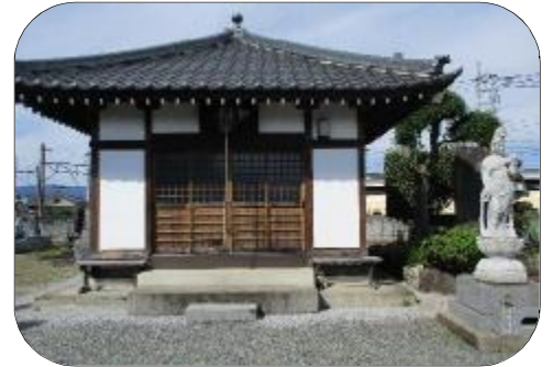
地蔵堂（森戸）・西大家駅裏側