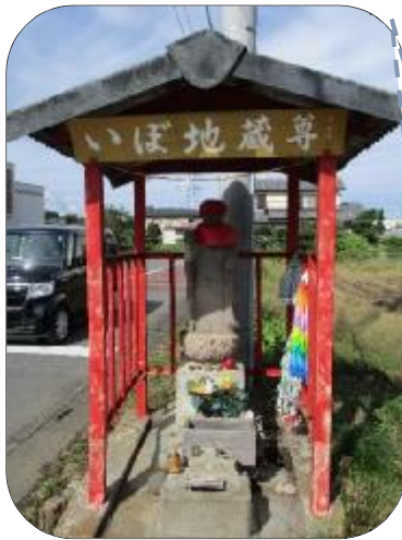
いぼ地蔵（多和目） ・多和目の交差点

いぼで苦しんだ人々が、願をかけ治るとお札にたすきや帽子を地蔵にかけている。訪れた日は、柿と栗がそなえられている。