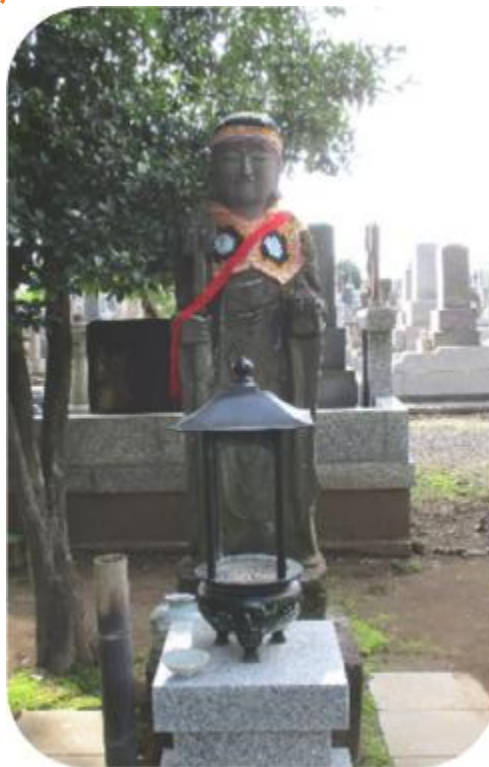
黒川地蔵（石井） ・大智寺の境内

母の愛したお祭りと、いつもお参りしていた延命地蔵 「おんかかかまえいびさんそわか」