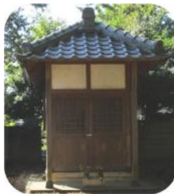
北向地蔵（中小坂） ・枝垂れ桜で有名な慈眼寺の近く

東円寺墓地入口の堂内にある。 一つの石の正面に六地蔵が浮き彫りになっている。大変珍しい地蔵である。